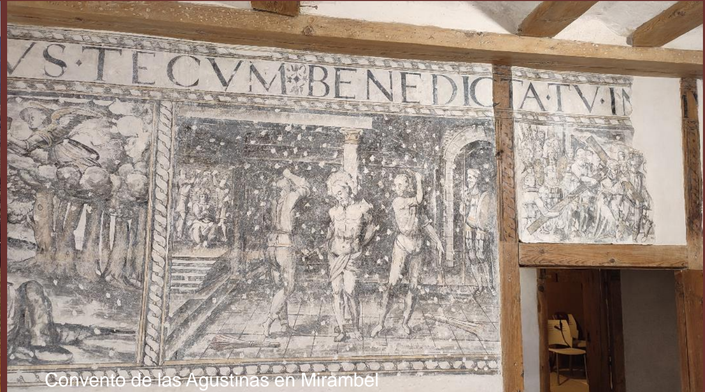
Convento de las Agustinas en Mirambel