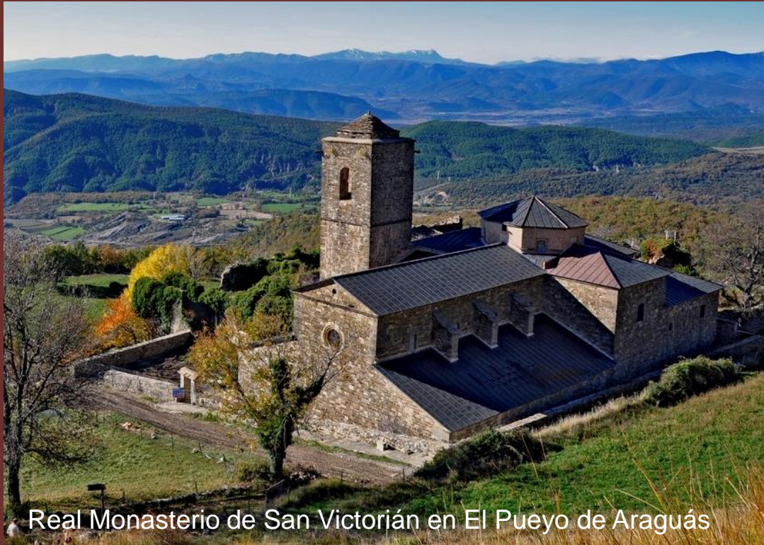
Real Monasterio de San Victorián en El Pueyo de Araguás