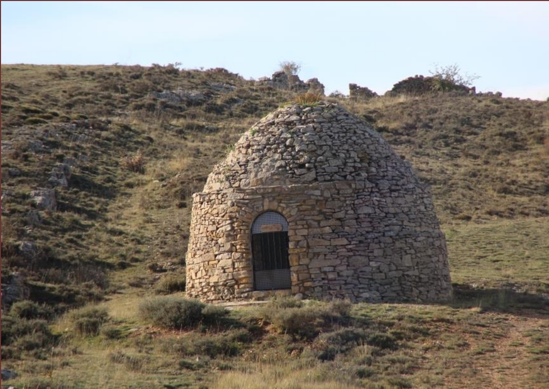
DECLARACIÓN BIC MONUMENTO Neveras y Pozos de Hielo en Aragón