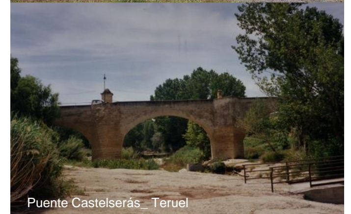
Puente Castelserás_ Teruel