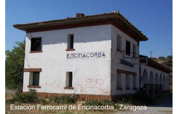
Estación Ferrocarril de Encinacorba_ Zaragoza