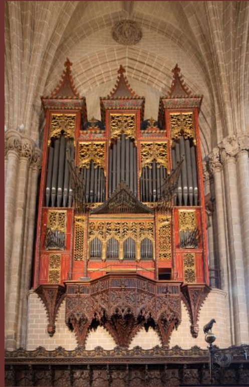
DECLARACIÓN BIC MUEBLE INCOADA Órganos históricos aragoneses