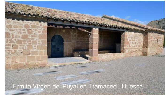
Ermita Virgen del Puyal en Tramaced_ Huesca