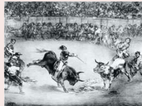
El famoso americano Mariano Ceballos. Francisco de Goya. Siglo XIX