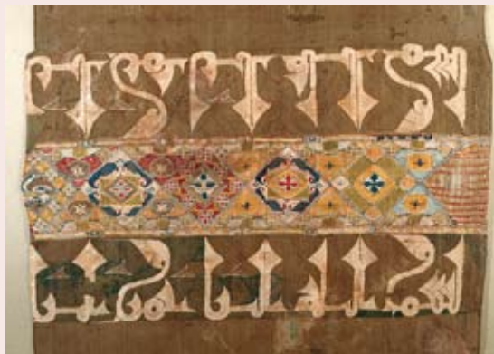
Tiraz. Tela islámica. Siglo XI