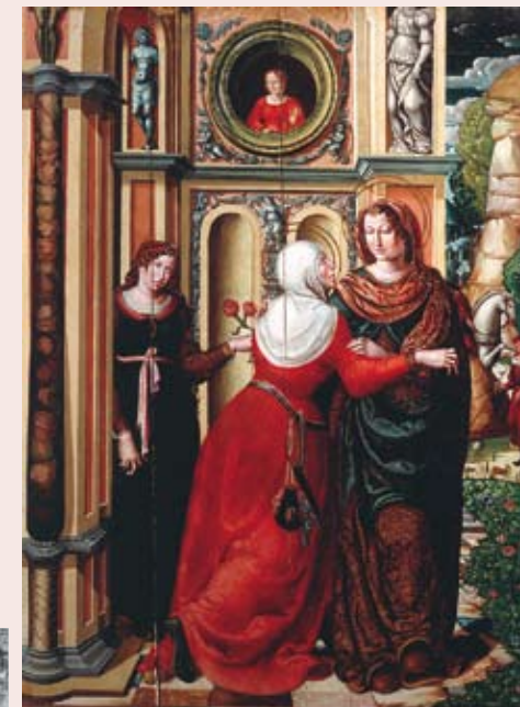
La Visitación. Maestro de Sijena. Siglo XVI

Las manifestaciones artísticas expuestas se inician a partir del s. XIII y se presentan a lo largo de 4 salas (5 a 8). Destaca la antigua capilla de la Universidad Sertoriana con su retablo original de estilo barroco y las tablas del monasterio de Sijena, Goya y su entorno, Valentín Carderera, mecenas y artista, la Universidad Sertoriana y sus símbolos y la obra del gran artista oscense Ramón Acín.