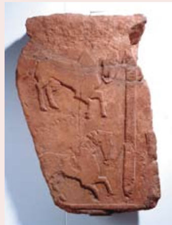
Estela de los caballos. Época ibérica